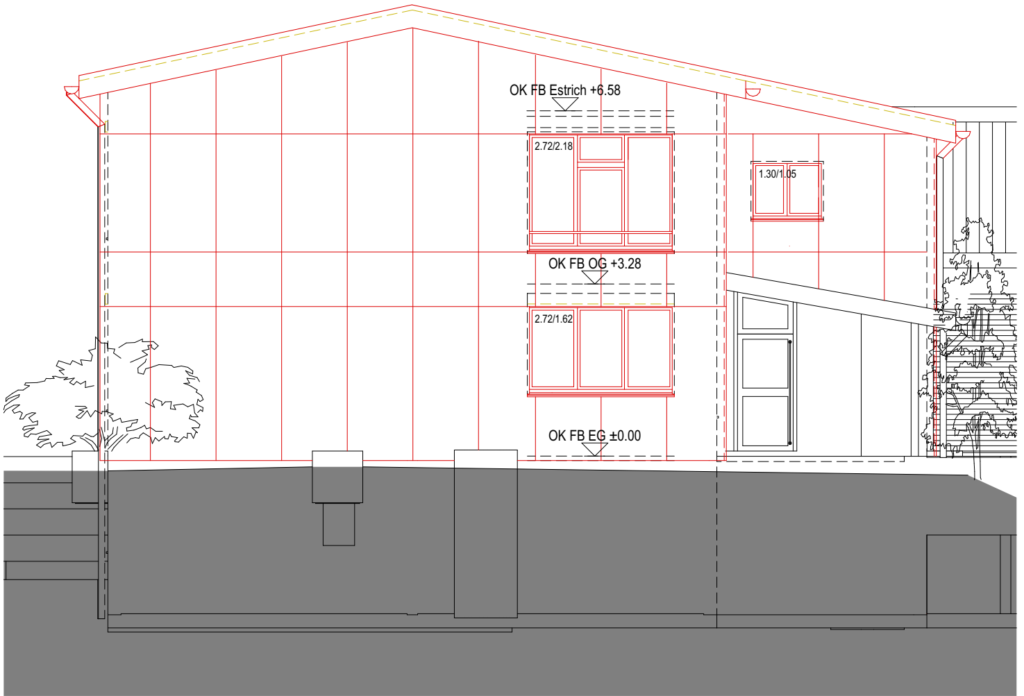
Fassade Nordost M 1:100